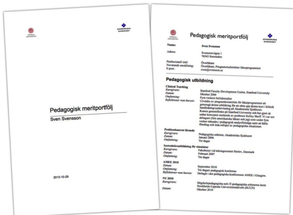
Figur 5. Figuren visar ett exempel på försättsblad samt första sidan av det slutgiltiga utskriftsdocumentet.

Denna utskrift görs i RTF-format (Rich Text Format), vilket gör att de flesta ordbehandlare kan läsa och skriva dokumentet (Figur 5). Användaren kan således även ändra exempelvis radbrytningar och typsnitt i det slutgiltiga dokumentet om så önskas.